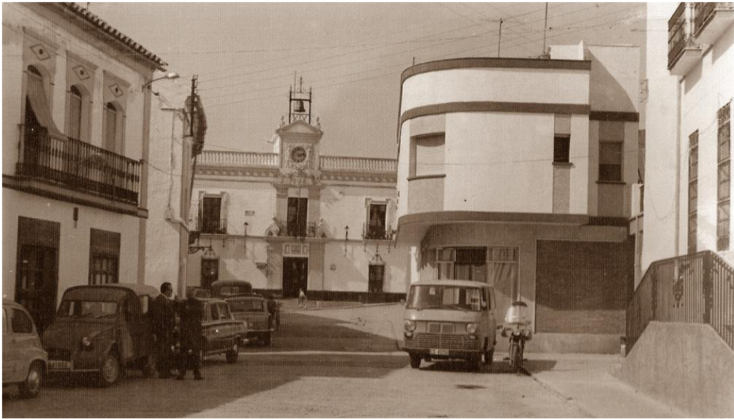
Plaza de la Constitución. Años 60.