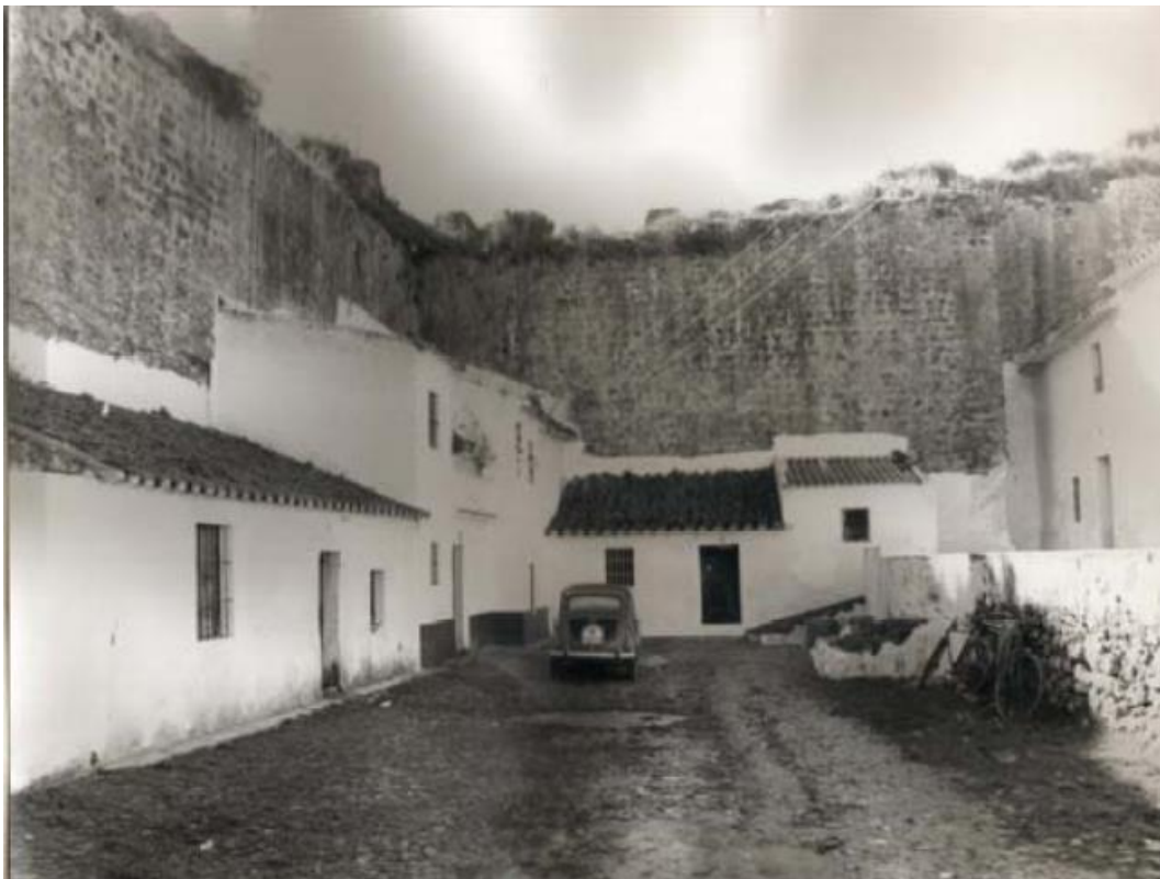
Patio de Armas. Aprovechamiento del espacio para viviendas adosadas, conformando un doble patio interior. Seat 600 y los inicios del desarrollo económico. La provincia de Córdoba en sus documentos gráficos: Hornachuelos . Córdoba: Diputación, 2007.