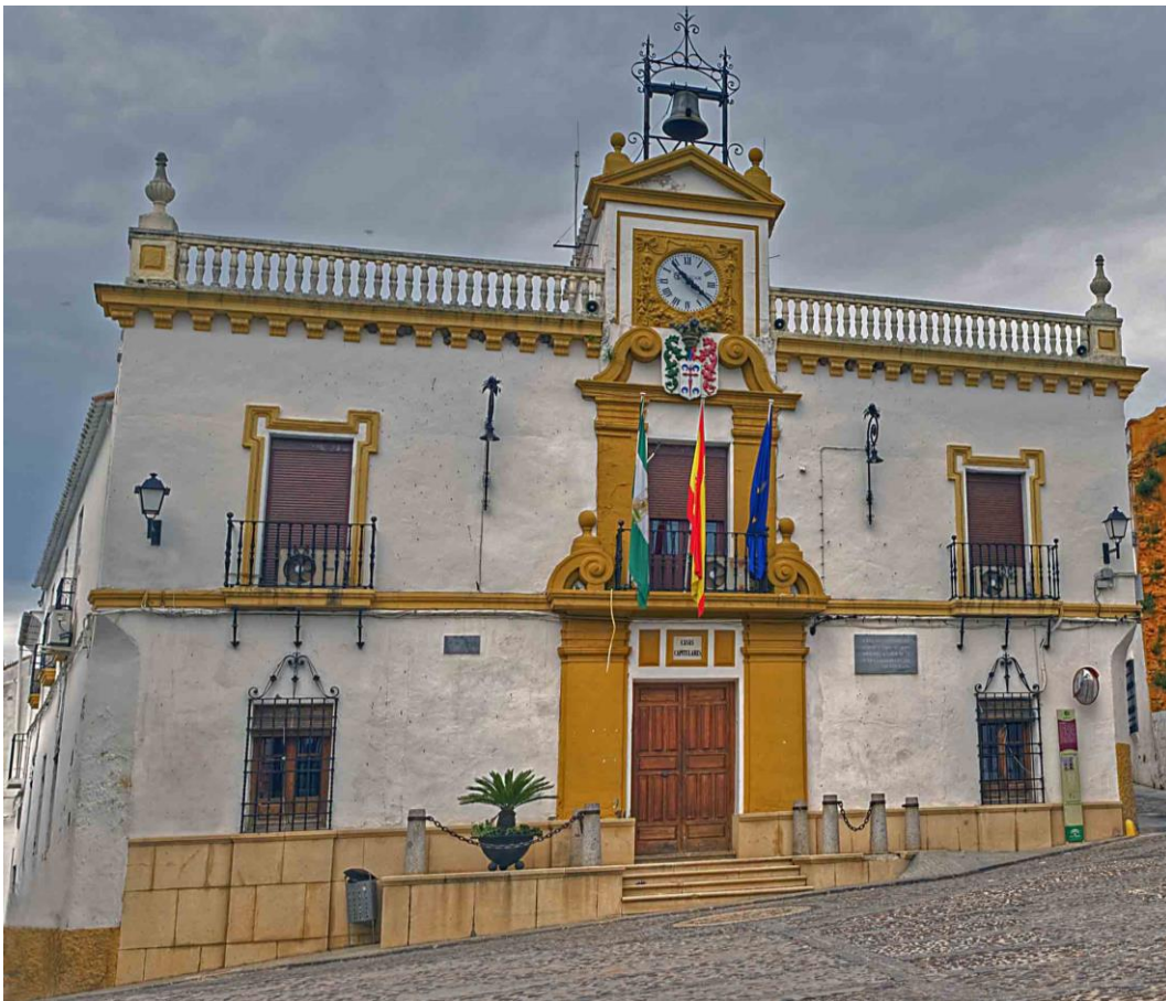
Ayuntamiento de Hornachuelos. Autor: Paco Madrigo.