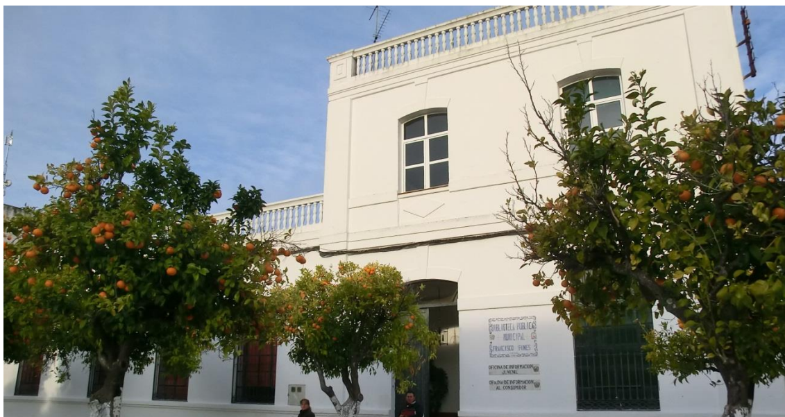
Autor: Óscar Morales