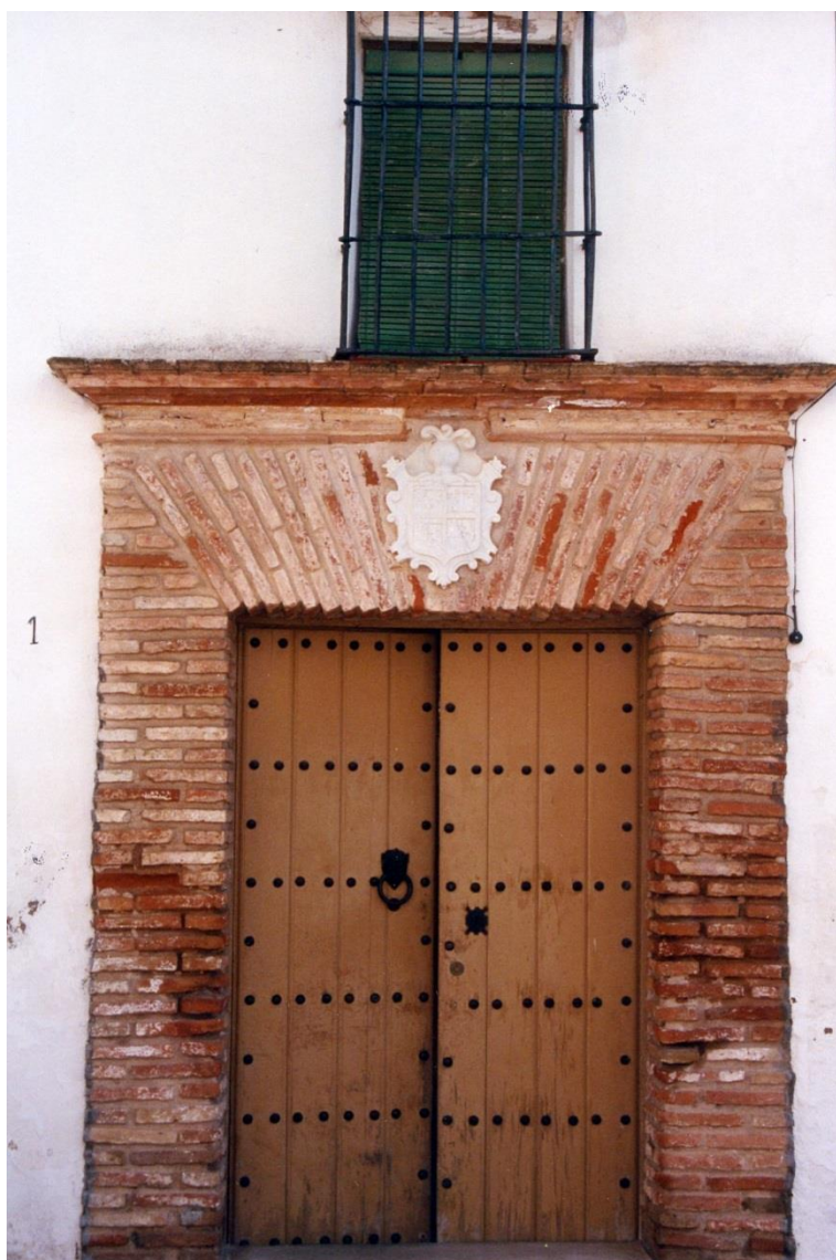
Fachada. Año 1999.