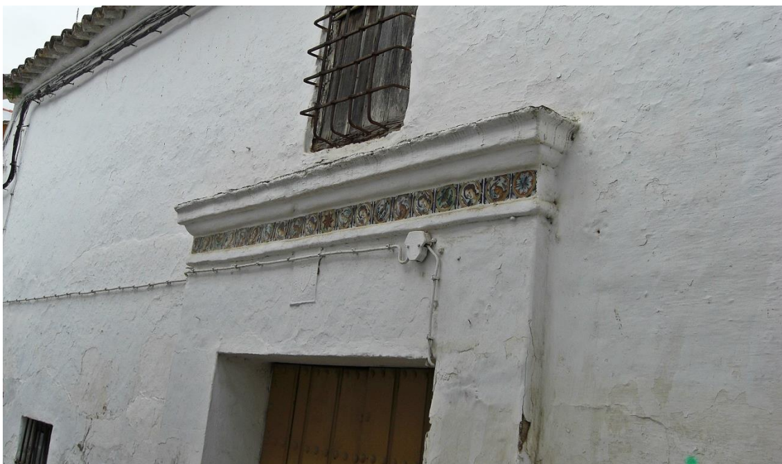
Posada. Autor: Óscar Morales.