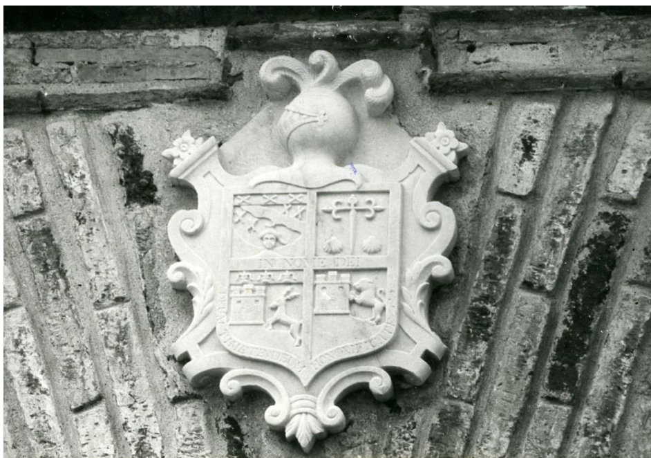
Escudo de la portada. Año 1994.