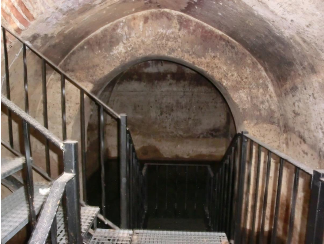
Interior del aljibe