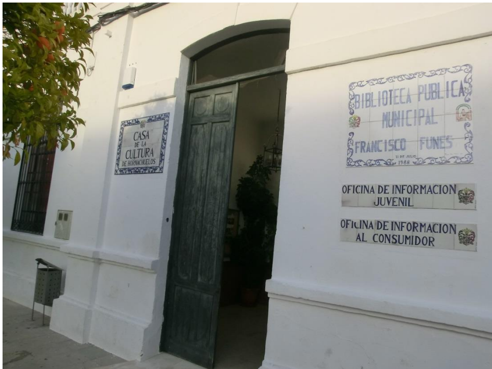
Autor: Óscar Morales