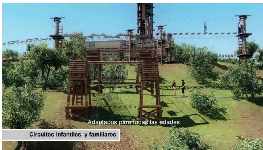
Adaptados para todas las edades

El Trotasierra empieza a mostrar sus avales de cara a la próxima temporada. p.14