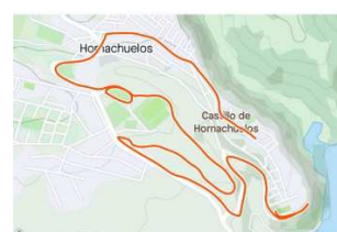
Andando a visitar a la abuela