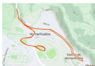
Andando a las compras del día