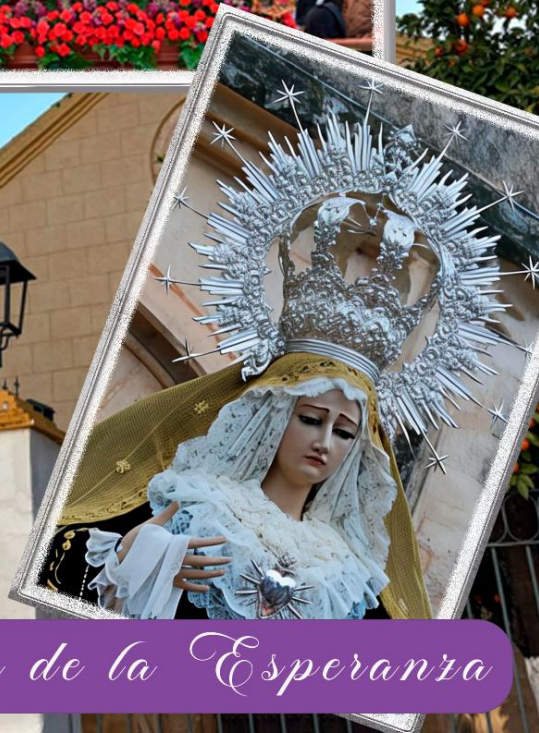
La Semana Santa de la Esperanza