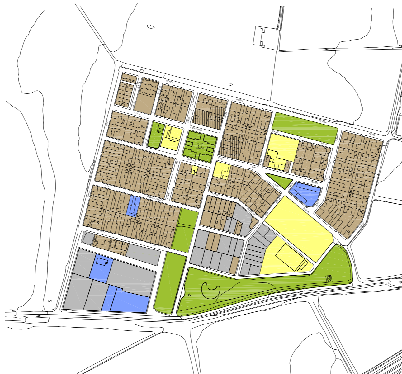
mesas de guadadora