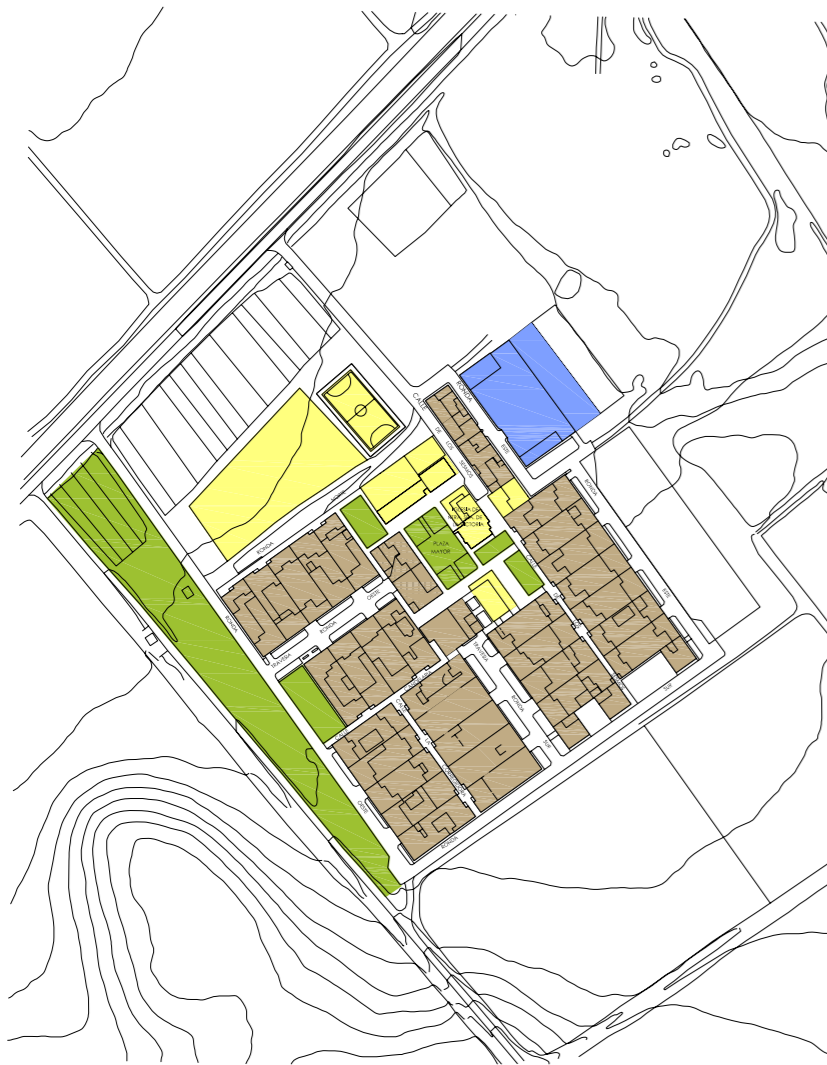
puebla de la parrilla